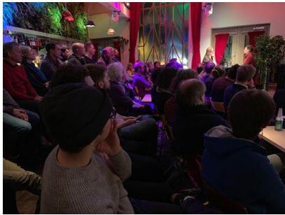
Filmclub Grand Theatre

In 2019 is in het Grand Theatre een filmclub ontstaan die in 2020 uitmondde in de oprichting van de Filmvereniging Groningen. De filmclub komt eenmaal per maand in het Grand Theatre bij elkaar om diverse film gerelateerde onderwerpen te behandelen. De coördinator van Beeldlijn was één van de genodigden bij de eerste filmclubeditie. Daarop volgden er nog een tiental, waar aan de hand van de te bespreken thema's of personen altijd beeldmateriaal wordt vertoond. Na een montagesessie met Jos Hoes heeft BL bij de Filmclub een preview georganiseerd met de voorlopige, ruwe versie van de film Beeld voor Beeld , een gedurfde stap die door film makend Groningen erg gewaardeerd is. Ook andere makers overwegen een dergelijke preview. De formule van de filmclub werkt erg inspirerend en trekt vooral ook jonge filmmakers uit de noordelijke regio aan.