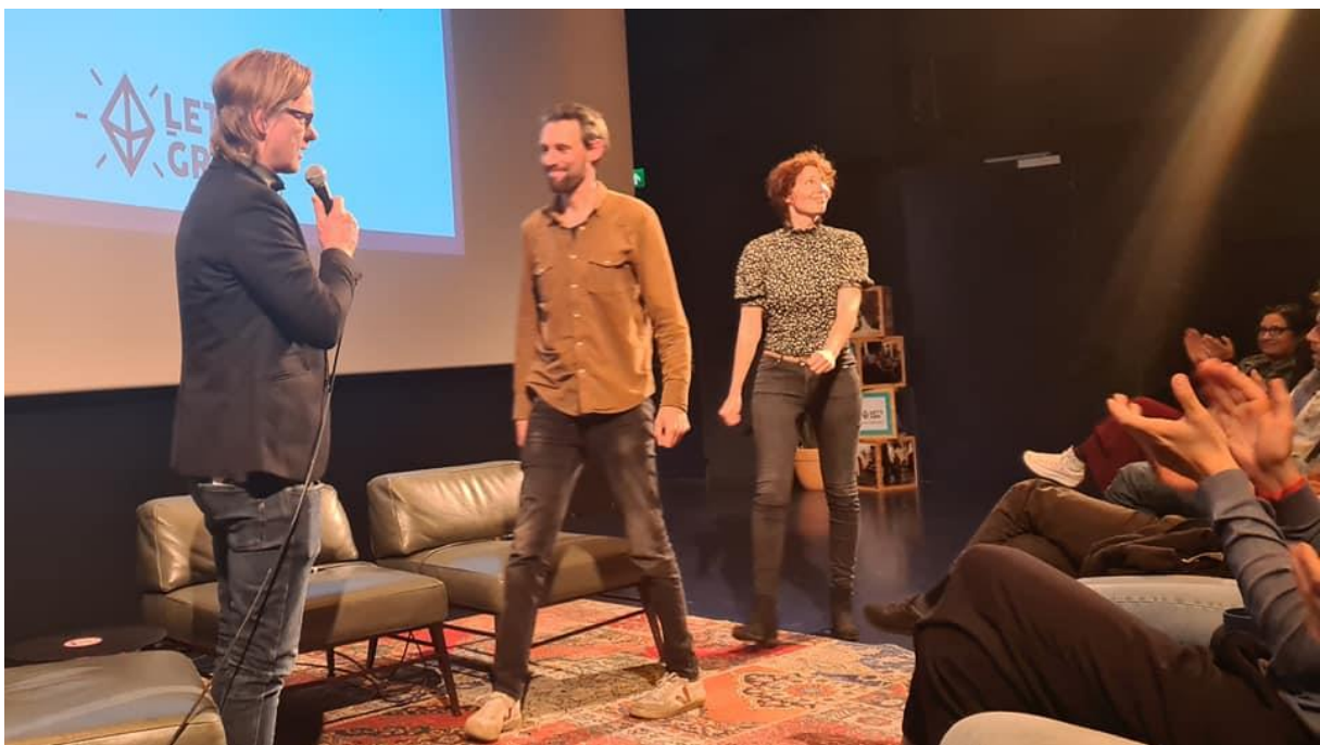
Première Weg uit de stad

Inhoudelijk was het een jaar waarin de nieuwe koers gestalte moest krijgen. De overgang naar een stichting waarbij jonge makers een kans krijgen, inhoudelijk de breedte wordt ingegaan en Beeldlijn een nog steviger positie inneemt binnen de Groninger filmwereld. Dit verslag laat zien dat we groeien in deze rol, dat Beeldlijn steeds zichtbaarder wordt, we een belangrijk deel uitmaken van het filmklimaat en dat we een onmisbare steun zijn voor makers in het noorden.